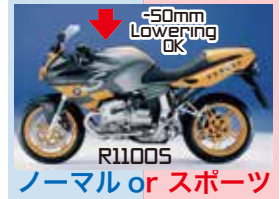
ノーマル or スポーツ