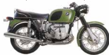
BMW R60/5/6/7 (BMW R60/5/6/7&247E)

R サスは 630TS&New632TS(Blow-OFF) シリーズがラインナップ！ ご注文の際は年式、フレームナンバーなどおしらせください。 大変貴重な車体かつ専門的な技術者が必要な車体となりますので ご注文の際は BMW ディーラー及び専門ショップ経由にて装着を 強く推奨致します。