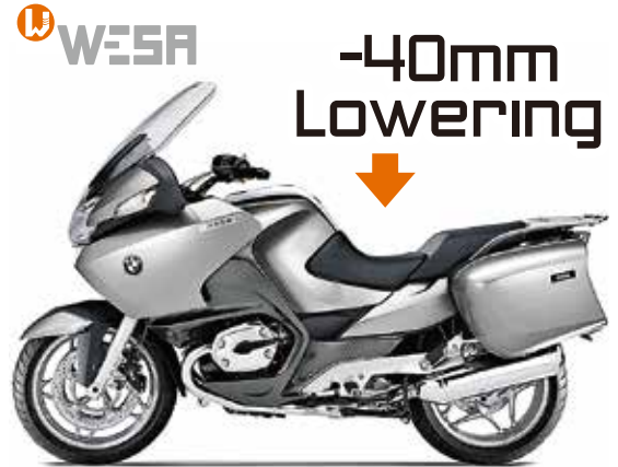
R1200R mit WP ESA