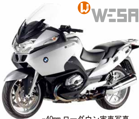
-40mm ローダウン実車写真