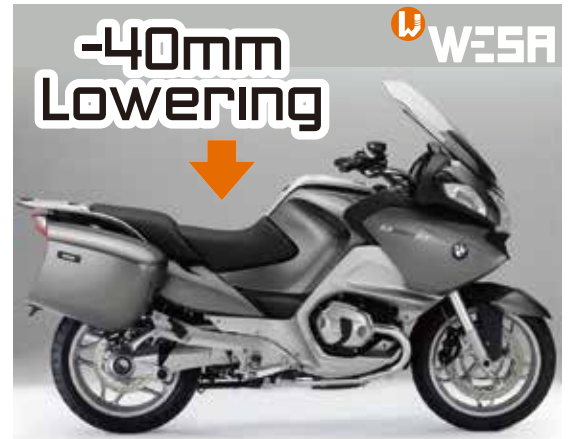
R1200R mit ESA II